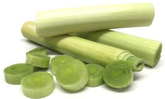
Stangenlauch Türkei 2.65 / Kilo