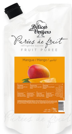
Mango Délices des Vergers (gekühlt) Indien 9.90 / Kilo