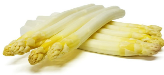
JUCKER-SPARGEL WEISS GESCHÄLT (KLASSE 2)