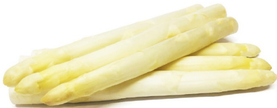
JUCKER-SPARGEL WEISS GASTRO (20-22MM)