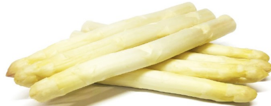
JUCKER-SPARGEL WEISS DICK (22MM-27MM)