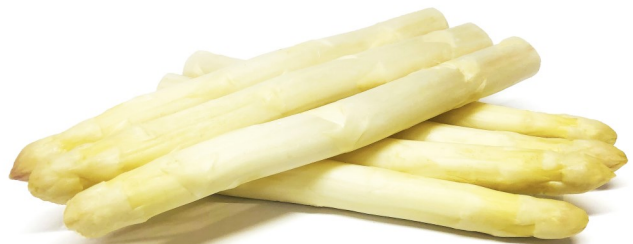
JUCKER-SPARGEL WEISS DICK (22MM-27MM)