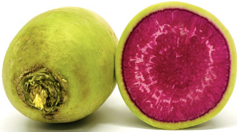
Wassermelonen Rettich (Red Meat)

Fein in Scheiben gehobelt und auf einem Salatteller präsentiert, dürfte dies die Neugierde Ihrer Gäste wecken. Positiv kommt hinzu, dass diese Sorten aktuell aus Frankreich kommen und den Weg mit dem Camion zu uns finden.