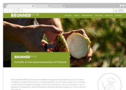
Brunner KA-GE Bassersdorf (ZH) Nur 13 km Fahr-Distanz bis zu Reust!